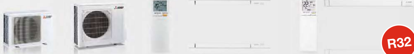
MUZ-AP20VG / AY25-42VG